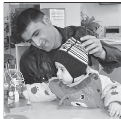
Пока мама оформляет документы, папа с малышом проводят время в игровом уголке