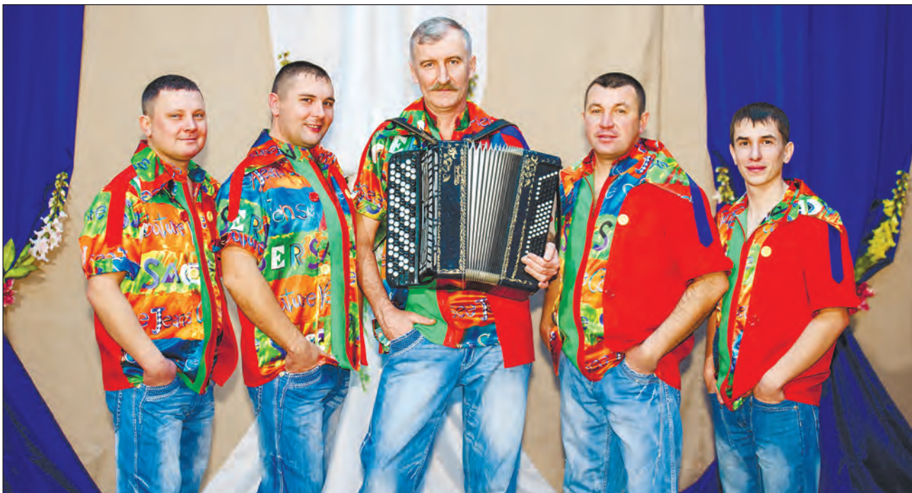
■ Ансамбль в полном составе