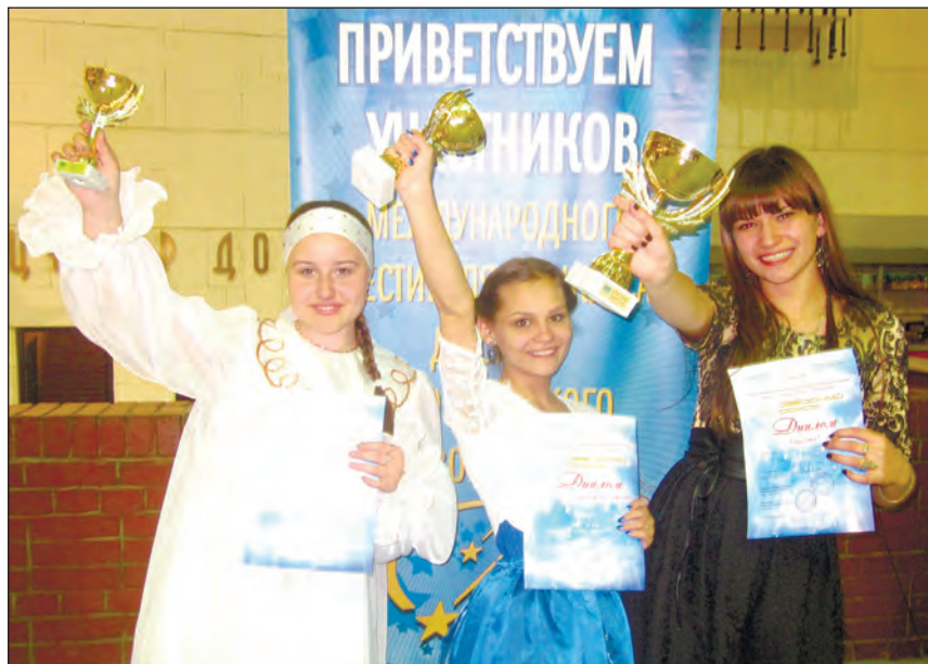
■ Солистки «Большой перемены» с заветными наградами

Богучарские вокалистки соперничали с конкурсантами из Воронежа, Белгорода, Липецка и других городов.