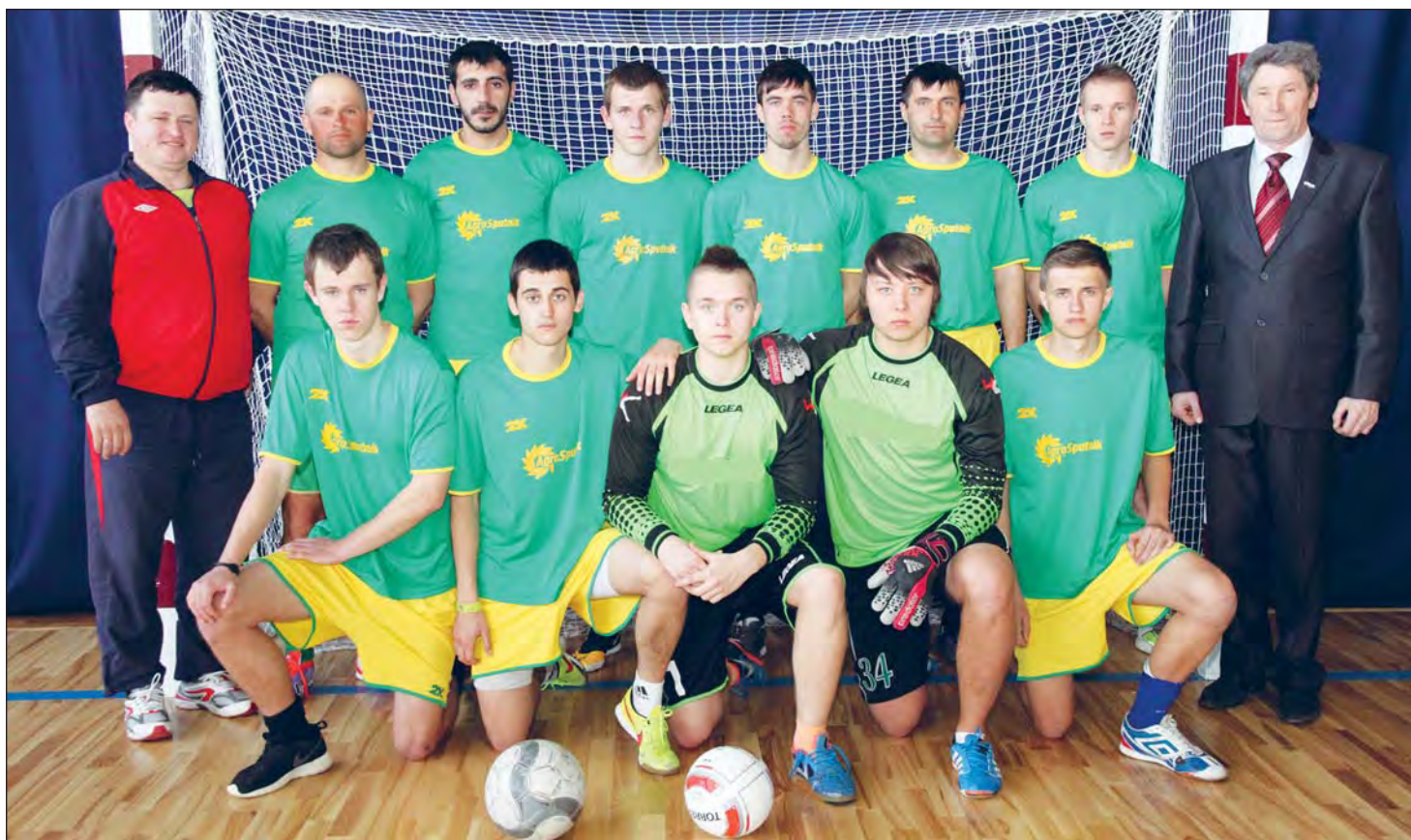
«Серебряная» команда нашей мечты

В финал чемпионата наша команда вышла с таким запасом сил и мастерства, что сопернику – команде «Хлебороб» из районного поселка Хохольский – было не очень комфортно даже на собственном поле. Так что начинался финальный матч нервно. Добавляло накала атмосфере и то, что обычно заключительные игры чемпионата проводились на нейтральном поле, а тут вдруг за две недели до этого матча спортивное руководство области и федерации футбола принимают решение проводить игру между «Агро-Спутником» и «Хлеборобом» в Хохле. При том, что матч за третье место между командами Россосхи и Борисоглебска в соблюдение спортивного принципа провели на нейтральной территории. Но проехав свои 300 километров, богучарцы вышли на поле с настроением побеждать.